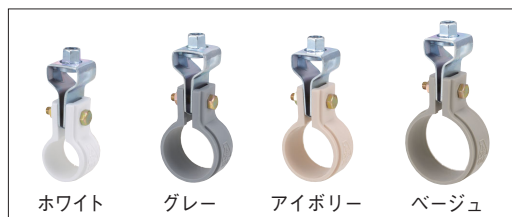
品番コード A10464 PP吊タン付