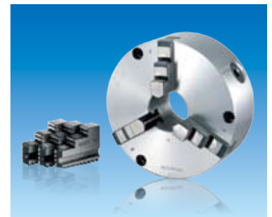
前面取付仕様 / 前面・背面取付兼用仕様